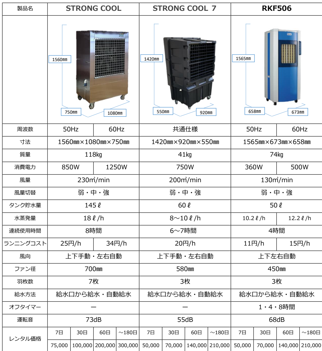
■ 気化式冷風機 比較表